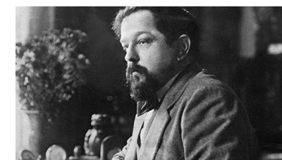
Claude Debussy (1862 - 1918)

Compositeur français de la fin du 19 ème siècle, avant-gardiste de la musique moderne, créateur original où souffle le vent de la liberté, avec "clair de lune" inspiré d'un poème de Verlaine nous espérons que cet hommage vous inspirera.